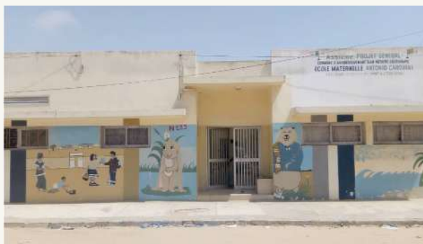
Campaña de ayuda ante la crisis humanitaria