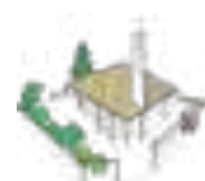
Parroquia Jesús de Nazaret