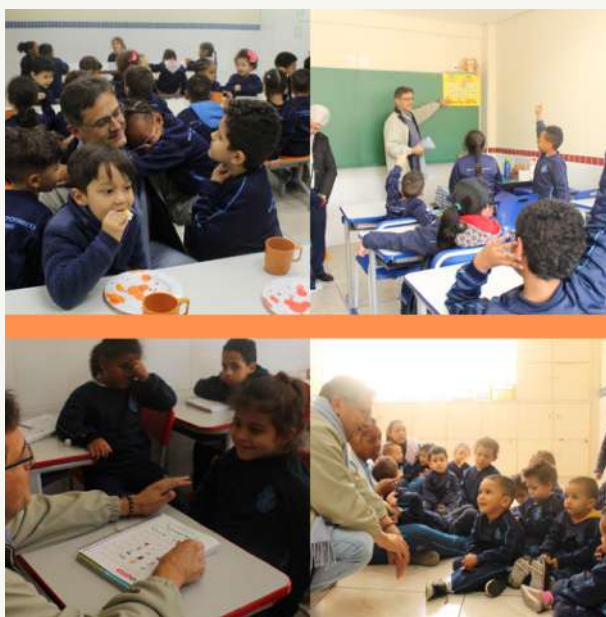
Proyecto Creciendo Juntos